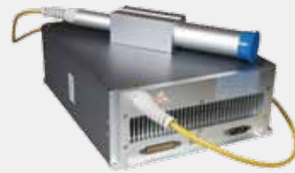
MOPA レーザー発信器搭載